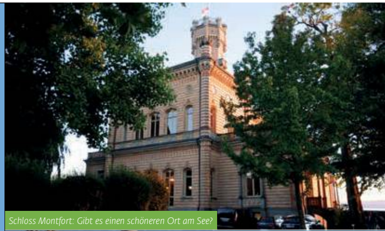
Schloss Montfort: Gibt es einen schöneren Ort am See?